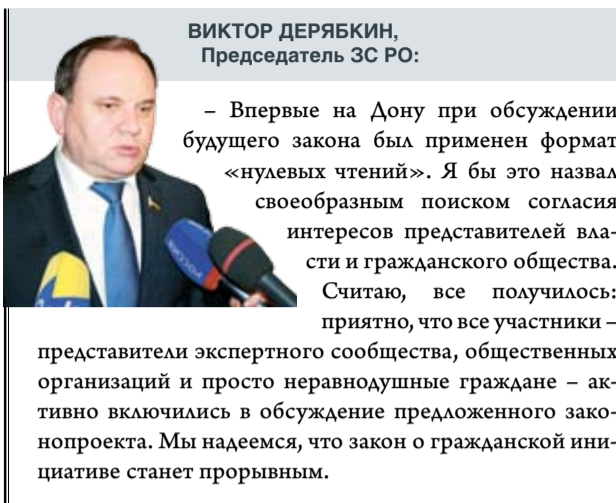
ВИКТОР ДЕРЯБКИН, Председатель ЗС РО:

– Впервые на Дону при обсуждении будущего закона был применен формат «нулевых чтений». Я бы это назвал своеобразным поиском согласия интересов представителей власти и гражданского общества. Считаю, все получилось: приятно, что все участники – представители экспертного сообщества, общественных организаций и просто неравнодушные граждане – активно включились в обсуждение предложенного законопроекта. Мы надеемся, что закон о гражданской инициативе станет прорывным.