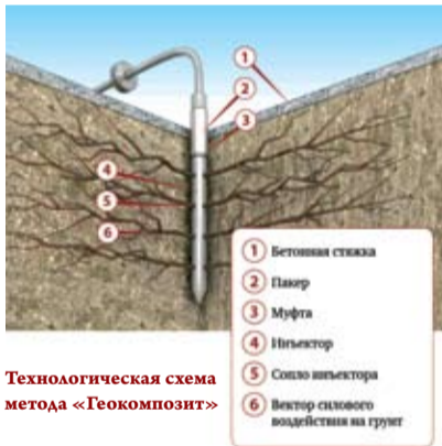
Технологическая схема метода «Геоконкомпозит»

После укрепления грунтов инъекционным методом в режиме гидроразрывов застывший цементный раствор образует армирующий каркас, напоминающий корни дерева, ствол которого является погруженный в грунт стальной инъектор с застывшим в нем цементным раствором. При этом происходит дополнительное улучшение механических характеристик вмещающего грунтового массива.