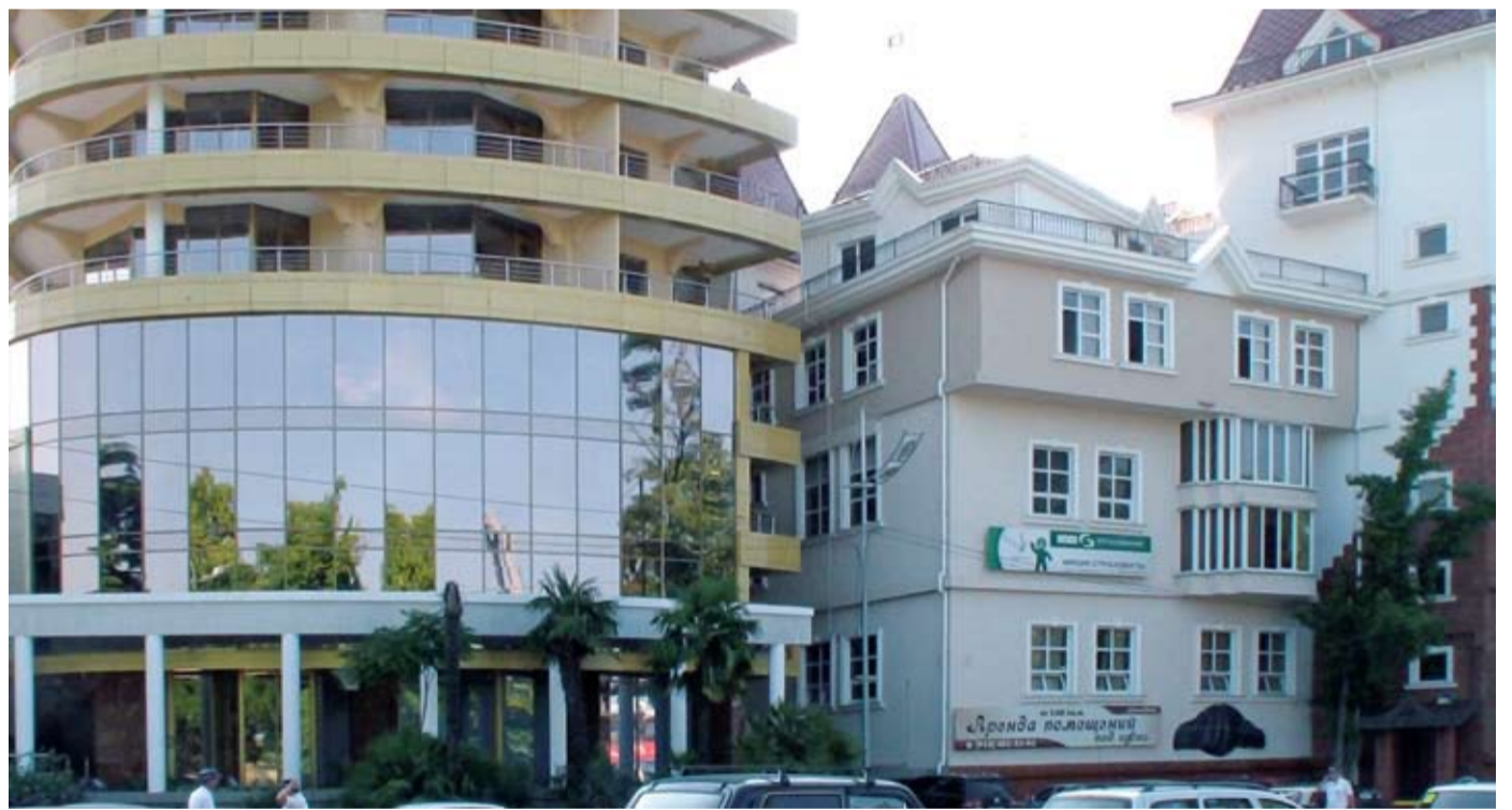
г. Сочи, апарта-отель Версаль

В настоящее время компания выполняет не менее сложные работы по укреплению грунтов основания жилого 22-этажного дома в Волгограде. Занимаемся и малоэтажным строительством в Волгодонске и Цимлянском районе. В целом же география наших объектов охватывает весь Южный федеральный округ. И хочу отметить, что благодаря высококвалифицированным специалистам, отличному техническому оснащению и сотрудничеству с институтом ООО ПИ «Горпроект-1» мы готовы работать на территории всей России.