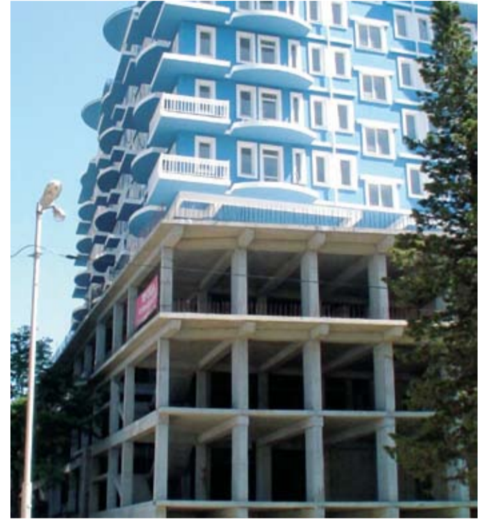
г. Сочи, Адлерский район, МРК Энергетик - Изумруд

– Наша специализация – укрепление (усиление) грунтов основания фундаментов (ленточных, плитных, столбчатых) зданий и сооружений, повышение несущей способности свай, усиление (укрепление) склонов и откосов, создание противовибрационных экранов. Укрепление грунтов инъекционным методом в режиме гидроразрывов можно использовать для любых сжимаемых дисперсных грунтов как естественного, так и геотехногенного происхождения – насыпные грунты, строительный мусор, культурные отложения, а также в заторфованных, суффазонных грунтах и илах. В нашей копилке множество объектов, на которых в полной мере была подтверждена надежность метода, основанного на данных технологиях. Мы работали в Краснодарском крае, в Волгограде. Один из самых сложных проектов, которые мы реализовали, укрепление грунта основания апарта-отель «Версаль» в Сочи. Особенность работ состояла в том, что укрепление грунтов выполнялось тогда, когда уже было возведено девять этажей здания. И инженерно-геологические условия были достаточно сложными. Но мы справились с поставленной задачей.