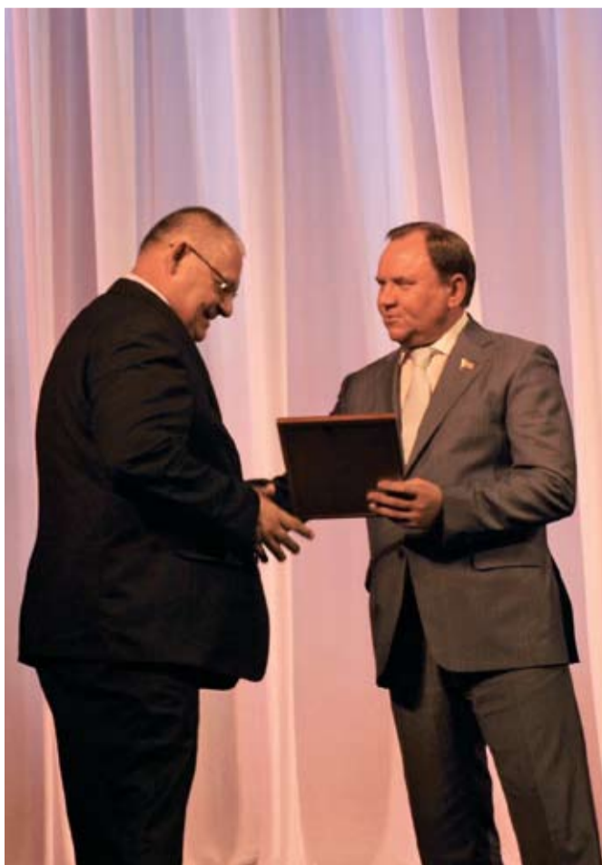
Ветеранам и передовикам отрасли были вручены награды Губернатора и Законодательного Собрания Ростовской области.

В Ростовском музыкальном театре накануне Дня строителя состоялось торжественное мероприятие, посвященное профессиональному празднику строительного сообщества. В нем приняли участие Губернатор Ростовской области ВАСИЛИЙ ГОЛУБЕВ , Председатель Законодательного Собрания Ростовской области ВИКТОР ДЕРЯБКИН , руководители областных министерств и ведомств, представители строительной отрасли Дона