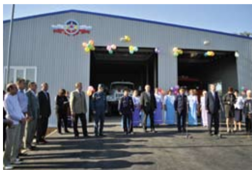
Пожарное депо в х. Парамонов

Оборот товаров, работ и услуг по крупным предприятиям вырос по сравнению с прошлым годом в 1,5 раза и составил 6 млрд 378 млн рублей. По