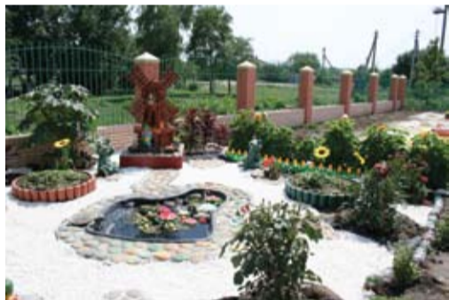
Детский сад в х. Александров

Экономика района представлена предприятиями промышленности, сельского хозяйства, железнодорожного транспорта и связи, строительства, торговли и общественного питания. Посредством создания новых рабочих мест, привлечения инвестиций, внедрения новых технологий, поддержки малого и среднего бизнеса район стабильно развивается.