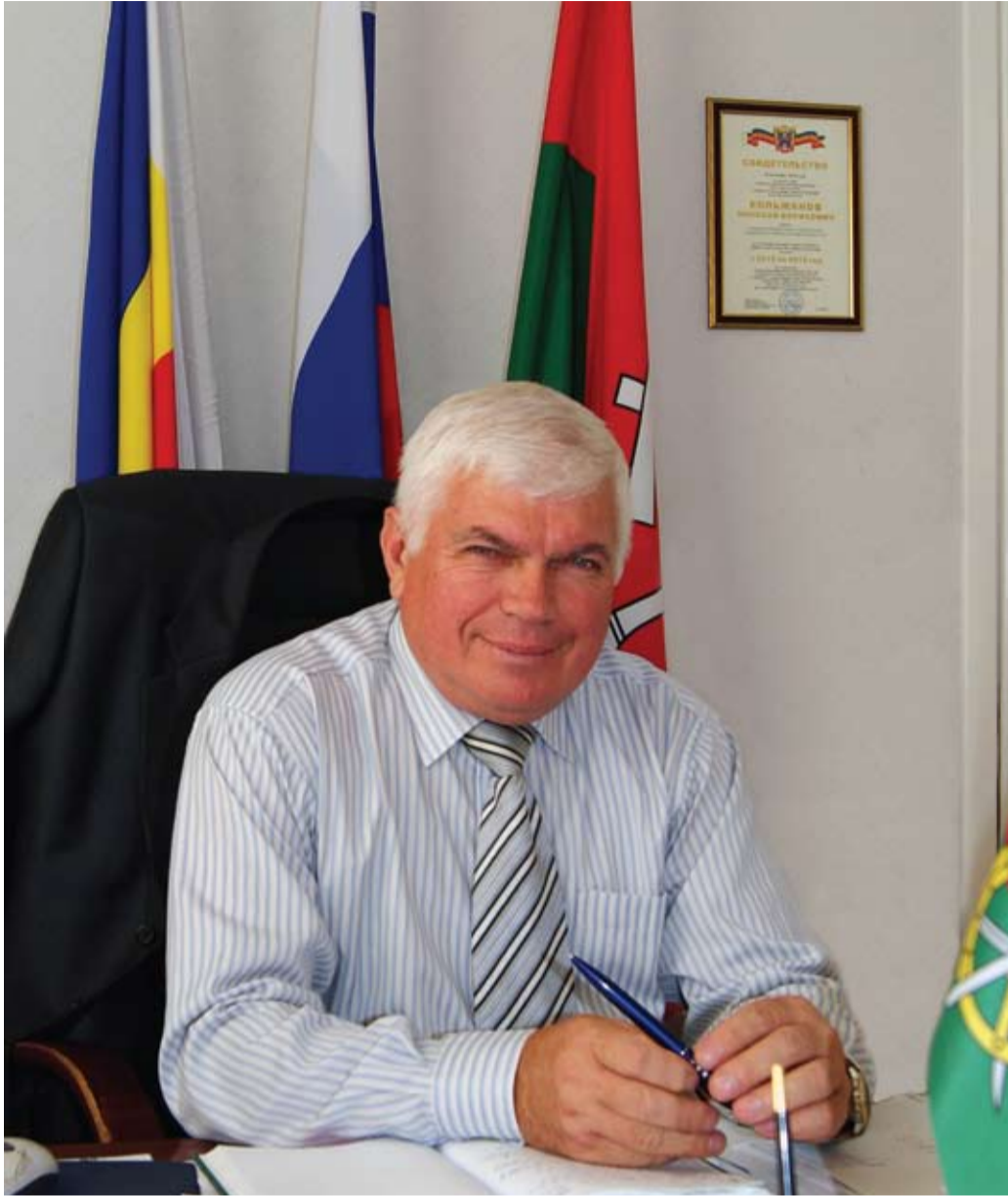
КОЛЬЖАНОВ НИКОЛАЙ БОРИСОВИЧ, глава Каменского района