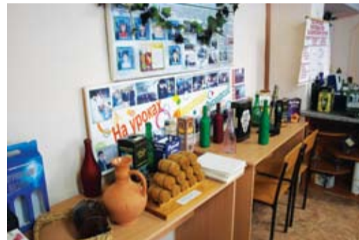
В аудиториях техникума

– Наш техникум на самом деле по праву считается учебным заведением со своей историей. Первые учащиеся перешагнули порог школы виноградарства и виноделия в сентябре 1905 года. Примечательно, что некоторые учебные корпуса сохранились до наших дней. В то время школа была закрытого типа. В ней учились только юноши в возрасте от 14 до 18 лет. Потом, в зависимости от политической ситуации в стране, учебное заведение несколько раз меняло свои названия, но основной профиль оставался неизменным.