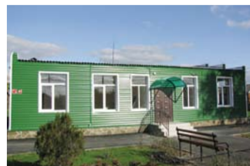
ФАП в х. Вознесенский

Средняя заработная плата в строительстве составила 13 тысяч 917 рублей. Рост составил 7%.