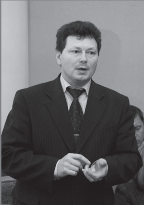
Министр экономики В.П. Бартенев