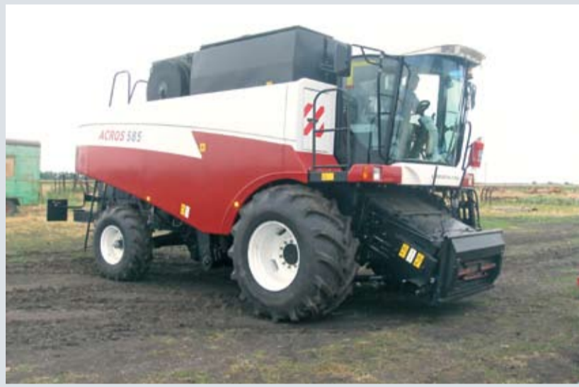
НОВЫЕ КОМБАЙНЫ ACROS 585

ACROS 585 прекрасно проявляет себя на полях с высокой и средней урожайностью. В основе комбайна лежит испытанное молотильно-сепарирующее устройство с одним большим барабаном и клавишным соломотрясом. Исключительная эффективность машины достигнута за счет высокой сменной производительности, надежности и хорошо налаженного сервисного обслуживания.