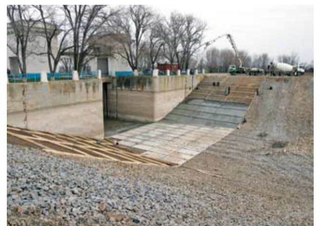
Беседовала Ирина Астапенко

– Мы работаем в постоянном контакте с Правительством области, Министерством сельского хозяйства, аппаратом Губернатора и его заместителями, в частности – заместителем Губернато-