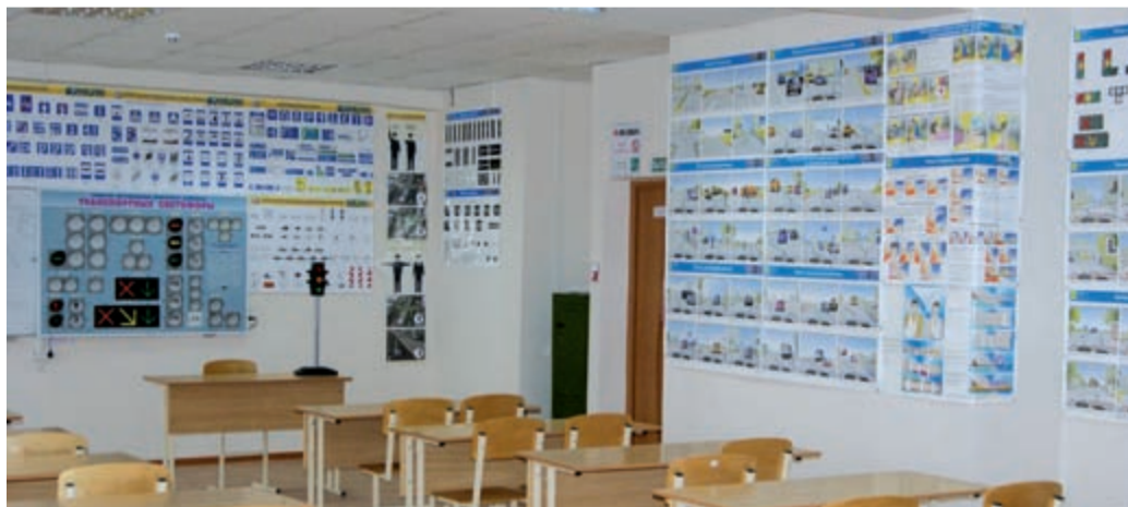
Учебная аудитория для проведения занятий по ПДД

Обучение проводят высококвалифицированные преподаватели ПДД и мастера производственного обучения вождению