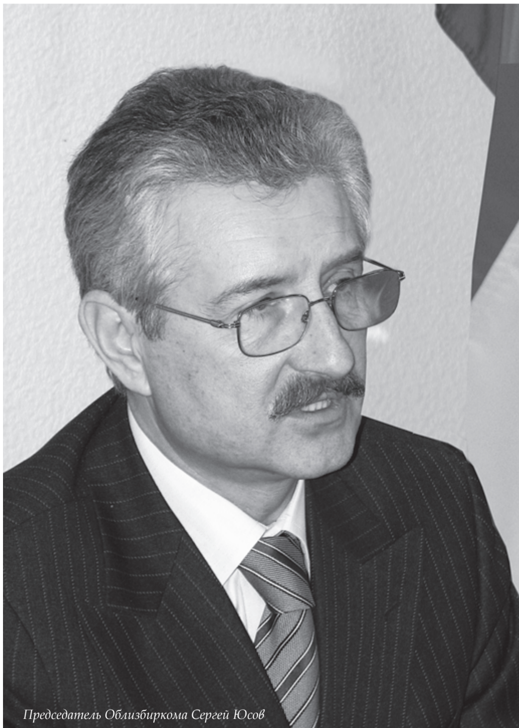
Председатель Облизбиркома Сергей Юсов