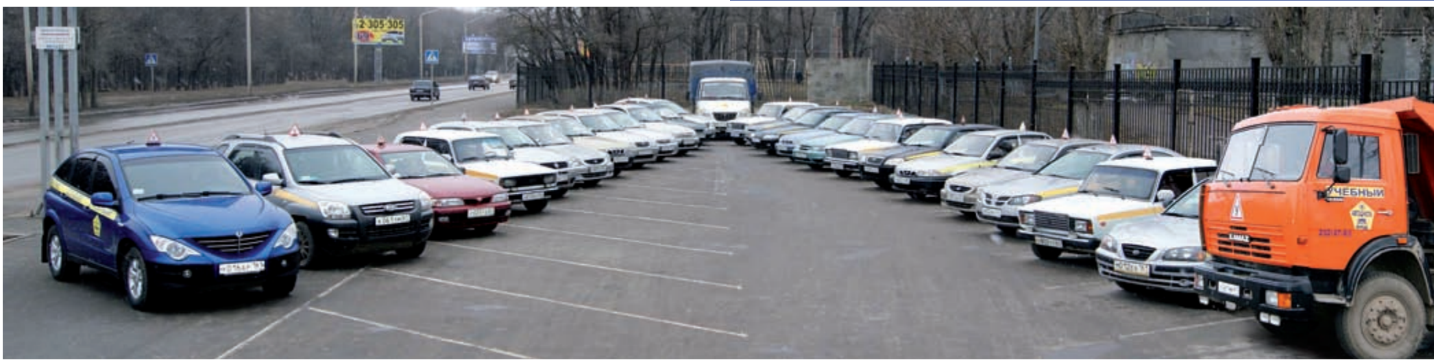
Смотр автомобильной техники НОУ НПО «Объединенная техническая школа»