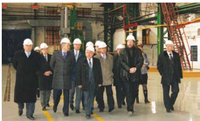
Депутаты в ОАО ТКЗ «Красный котельщик» и ОАО «ЭМАльянс»

Довольно долго и напряженно Администрация города и Городская Дума разрабатывали Положение «О регулировании земельных отношений в г. Таганроге». Наконец, этот документ, призванный повысить эффективность использования городских земель и урегулировать отношения, возникающие между гражданами, юридическими лицами и органами местного самоуправления по вопросам выделения, распоряжения и пользования земельными участками, увидел свет и утвержден.