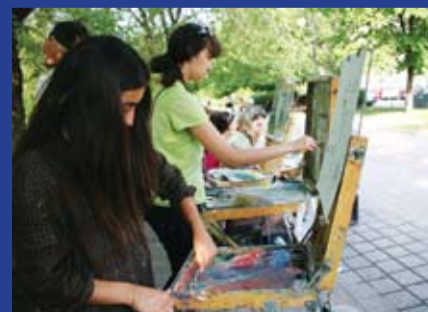
ЧТО НУЖНО ПРЕДПРИНЯТЬ ДЛЯ АКТИВИЗАЦИИ МОЛОДЕЖИ?

Совместное заседание Совета молодежного парламента при ЗС РО