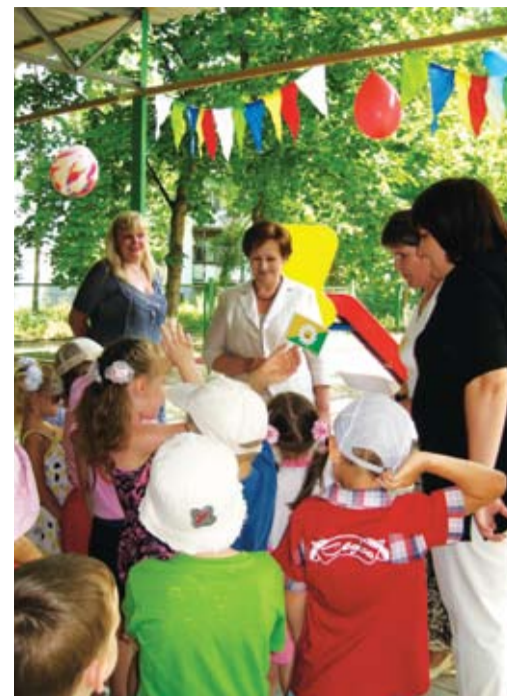
Выездное заседание постоянной комиссии по социальной политике, труду и защите прав граждан, посвященное знакомству с направлениями расширения сети дошкольных учреждений