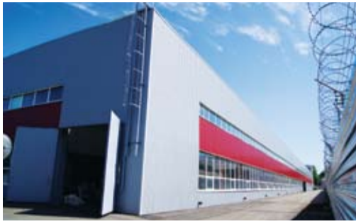
Фасад после реконструкции