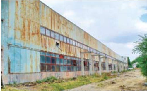
Фасад до реконструкции

В последнее время как на федеральном, так и на областном уровнях предпринимается целый комплекс мер для стимулирования развития отечественного производства, в том числе различных товаров народного потребления. Преимущества такого пути очевидны: снижение зависимости рынка от импорта и формирование доступной по цене линейки товаров, развитие экономической инфраструктуры на территориях, увеличение налоговых поступлений в местные бюджеты, создание новых рабочих мест и т. д. Проблема в том, что не многие предприниматели, ранее успешно поставлявшие на рынок импортные товары, решаются вложить силы и средства в создание отечественных производственных предприятий