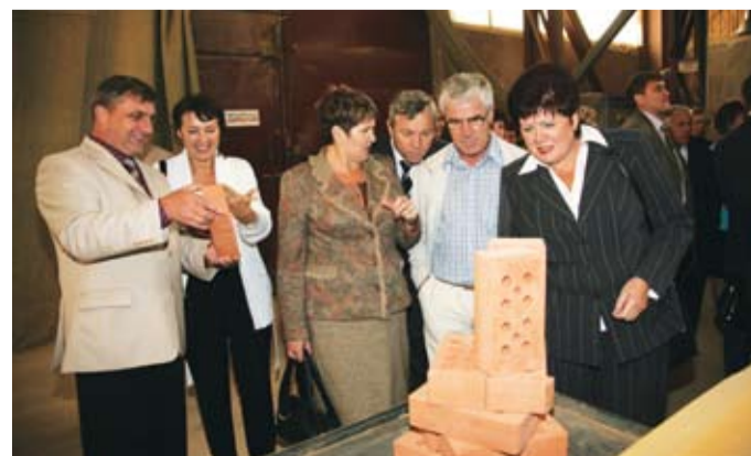
Выездное заседание в ОАО «Лемакс»