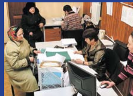
О ПОВЫШЕНИИ УРОВНЯ И КАЧЕСТВА ЖИЗНИ ЖИТЕЛЕЙ РОСТОВСКОЙ ОБЛАСТИ Заседание фракции «ЕДИНАЯ РОССИЯ» в ЗС РО