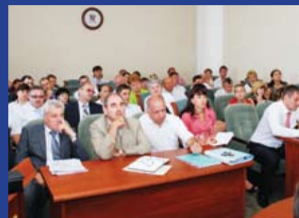
РАБОТА КОМИТЕТОВ ЗС РО