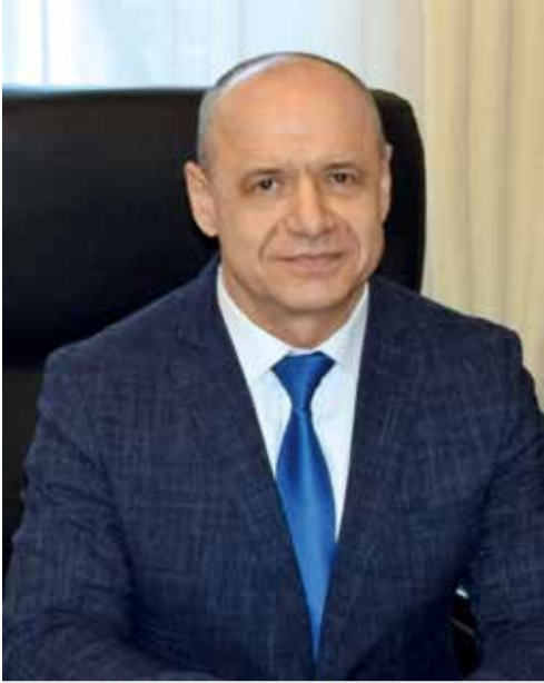
Константин Корнеев , председатель городской Думы города Шахты VII созыва