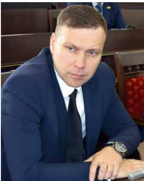
Вадим Новоселов , заместитель председателя комитета городской Думы города Шахты по социальной политике