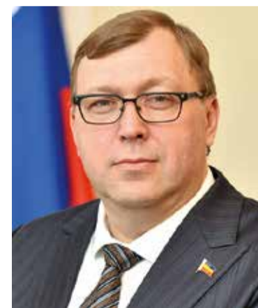
А.В. Ищенко Председатель Законодательного Собрания Ростовской области