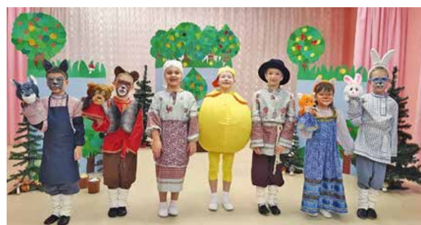
Детский сад «Глория» – необычное дошкольное учреждение. В нем все особенное – начиная с истории создания, статуса и заканчивая условиями, в которых развиваются дети, работают взрослые.

Подтверждением тому являются Гран-при муниципального фестиваля национальных культур «Карусель дружбы», Гран-при муниципального фестиваля «Юбилей зажигает звезды» в номинации «Край седой, ковыль-